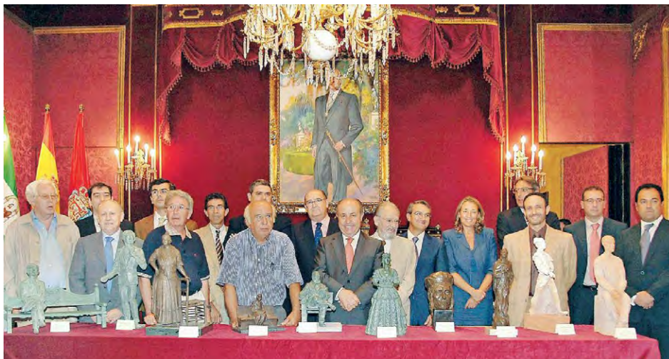
3. Salón de Plenos del Ayuntamiento de Granada durante la presentación de bocetos y la firma de contratos con los artistas para la realización de diez esculturas para instalarlas en el bulevar de la Constitución de Granada. Revista Paso a paso , octubre de 2008

ciben la misma valoración, el mismo valor que el trabajo productivo, ya que no generan ingresos económicos. Por esto, el control de la sexualidad y de la reproducción ha constituido y sigue siendo un asunto de vital interés para el sistema patriarcal, tanto en el terreno material como en el simbólico: el poder de la masculinidad se constituye precisamente como la conquista y dominación sobre las mujeres, y edifica las relaciones de género a través de un intrincado andamiaje donde se trenzan las normatividades institucionales con la construcción de las subjetividades (González, 2014: 2).