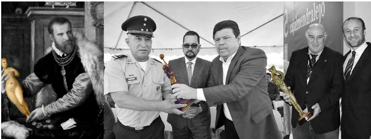
6. Trofeos. Tiziano, Jacopo Strada , 1561 h, Kunsthistorisches Museum. Viena (Austria). Entrega de trofeos realizados a partir del Monumento a la Mujer , Mexicali (México), 2015. Premio Musa de la Vendimia (reproducción de una obra de Juan de Ávalos) otorgado por la Cámara de comercio de Badajoz y el Ayuntamiento de Almedralejo en el Salón del Vino y la Aceituna de Almedralejo (Badajoz), 2013

teorito, como un ovni, como un objeto procedente de una galaxia extraña, sin la menor relación formal ni conceptual con el entorno, rompiendo totalmente la semántica del lugar y del espacio (Lippard, 2001: 61).