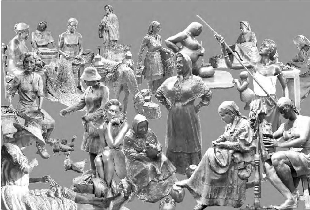
9. Colección III: Trabajadoras . Redera, José Miguel Mas Valls, 1999, Valencia. Pescadera , Sebastián Miranda, 2005, Oviedo. Vendedoras del Fontan , Amado González Hevia «Favila», 1996, Oviedo. Costureras de la Vega , José Luis Marrero Cabrero, 2009, Vega de San Mateo (Gran Canaria). Encajera o la puntaire , Josep Viladomat, 1972, Barcelona. Regadora de los patios , José Manuel Belmonte, 2014, Córdoba. Vendedora de gallinas , Cuqui Piñeiro, 2009, Pontevedra. Conservera , J. A. Barquín, 2002, Santoña (Cantabria). Dones Remendadores , María Dolors Ortuño, 1998, Cambrils (Tarragona). Castañera , Daniel Calvo Péres, 1999, Palencia. Castañera , Xoxe Cid, 2001, Orense. Lechera , Manuel García Linares, 1996, Oviedo. Guisandera , M. a Luisa Sánchez Ocaña Fernández, 2000, Oviedo. Pementeira , Ramón Conde, 2002, Padrón (La Coruña). Conservera , Pepe Gómez, 2003, Ayamonte (Huelva)

podemos imaginar a través de reproducciones, sean documentales o, como en el caso de los monumentos, ficticias. La proyección de estos sentidos homenajes hacia un tiempo pretérito, en un tono de compensación meramente simbólica, de agradecimiento por los servicios prestados, parece perseguir, como efecto secundario y no inmediatamente perceptible, que se dé por cumplida, con ese gesto, la obligación de reconocimiento del trabajo femenino más real e inmediato [9].