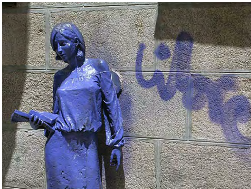
10. Julia , obra de Antonio Santín. Intervención con pintura morada en 2003, Madrid

hombre, no es nunca algo simple y evidente por sí mismo e invariable, ignorando también cómo esas identidades se ven atravesadas por otras formas de identidad y discriminación, como la raza o la clase social. Los derechos de las mujeres no pueden ser pensados abstractamente, al margen de la crítica de una estructura social que es fruto del sistema capitalista y patriarcal en marcos culturales específicos. Además, el monumento se inserta formalmente en la tradición androcéntrica de representación académica del cuerpo femenino: la adolescente ballerina como paradigma de una feminidad marcada por la gracilidad y la delicadeza; por la debilidad, en suma, de cuerpos obligatoria y recalcadamente jóvenes y esbeltos.