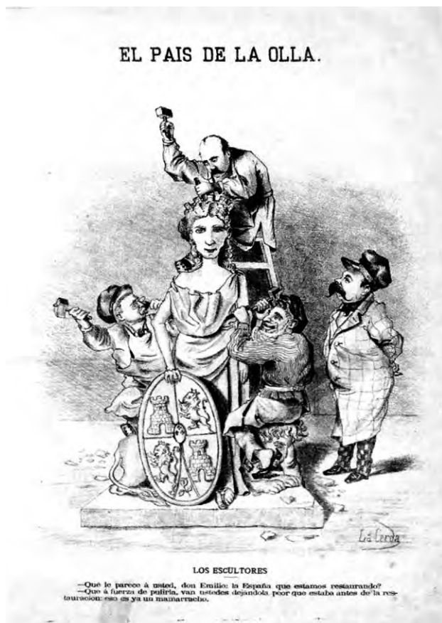
1. Los escultores , Emilio de la Cerda. El País de la Olla , 1882, Archivo Municipal de Málaga

Y es eso lo que lo convierte en un vehículo ideal de contenidos ideológicos: su presencia «naturalizada» en nuestra vida cotidiana, en los lugares centrales del espacio público, reproduce de modo sutilmente repetitivo, mediante actitudes, comportamientos y poses, «estetizadas» jerarquías y discriminaciones de género. Los monumentos, como señala el historiador Peter Burke, no solo guardan memoria de unos personajes o acontecimientos, sino que influyen de modo determinante en la forma en que esos hechos o personajes son percibidos, por lo tanto, producen sentido (2005: 183). El monumento aspira a ser eterno, busca dejar una huella del presente en el futuro, permanecer como un «legado a las generaciones futuras», exaltando la legitimidad de quienes ostentan el poder en el momento presente, que aparecen así como herederos naturales de las glorias del pasado.